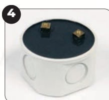
4 Za samo nekoliko minuta, proizvod se pretvara u gumu.