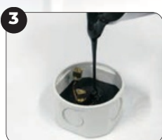
3 Sipajte proizvod u kućište za punjenje.